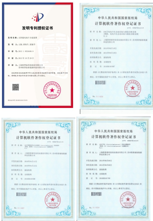
➤ 2016 年 5 月 19 日公司成功获得授权发明专利 1 项，软件著作权 3 项